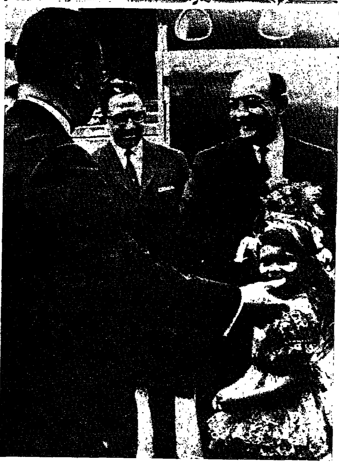
السيد محمود رياض وزير خارجية الجمهورية العربية المتحدة يتلقى من الزهور من طفلة فلسطينية لدى وصوله الى مطار هلستفي في طرابلس جنوة في ايطاليا الاستثنائية